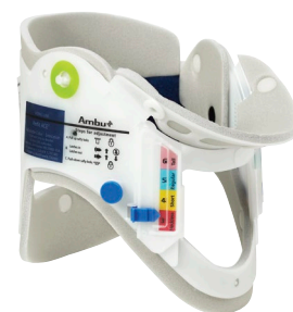
Ambu® Perfit ACE®.