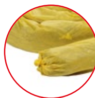
Evita que se esparza el derrame